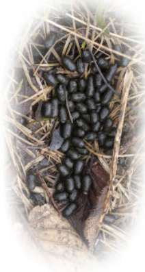
Losung Reh Die Länge der einzelnen Kotbeeren beträgt zwischen 10 bis 15 mm

Rehe können Menschen auf einer Entfernung von bis zu 400 Meter riechen. Das charakteristische Bellen, welches die Rehe zum Warnen der Artgenossen oder wenn sie eine Situation nicht ganz einschätzen können von sich geben, ist die häufigste Lautäußerung