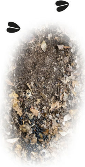
Rehbock (Schlafplatz/ Ruheplatz) auf dem Waldboden

Rehe sind die kleinste und am häufigsten vorkommende Hirschart. Rehe können Menschen auf einer Entfernung von bis zu 400 Meter riechen. Das charakteristische Bellen, welches die Rehe zum Warnen der Artgenossen oder wenn sie eine Situation nicht ganz einschätzen können von sich geben, ist die häufigste Lautäußerung